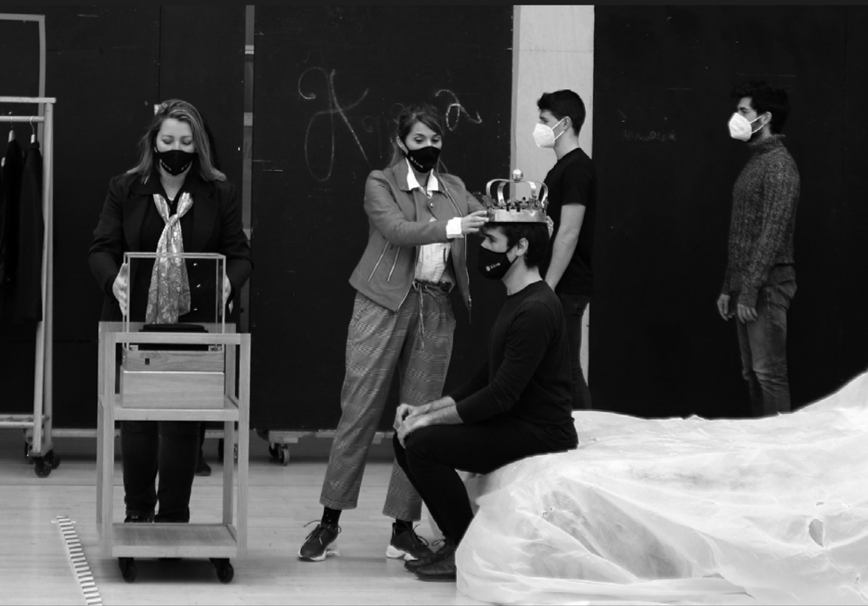
Ensayo de Lessons in Love and Violence en el Liceu