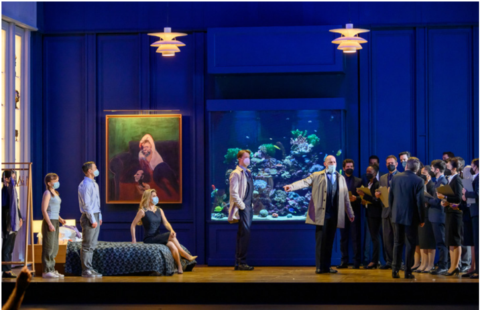
Ensayo de Lessons in Love and Violence en el Liceu