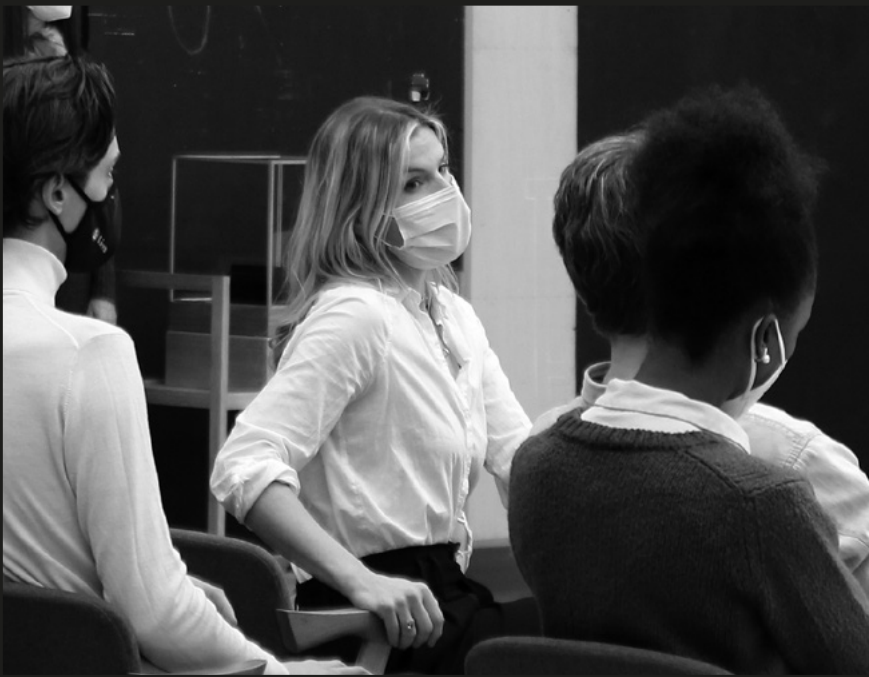
Ensayo de Lessons in Love and Violence en el Liceu