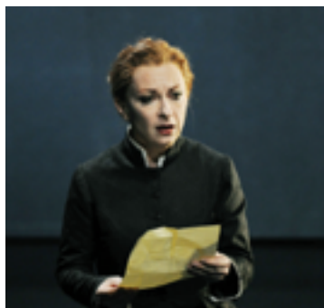
Michael Spyres i Laurent Naouri