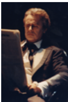
José van Dam