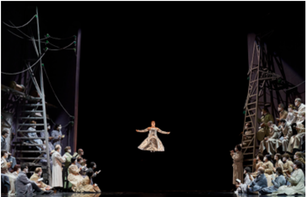
Assaig de Les contes d'Hoffmann al Liceu la temporada 2020/21