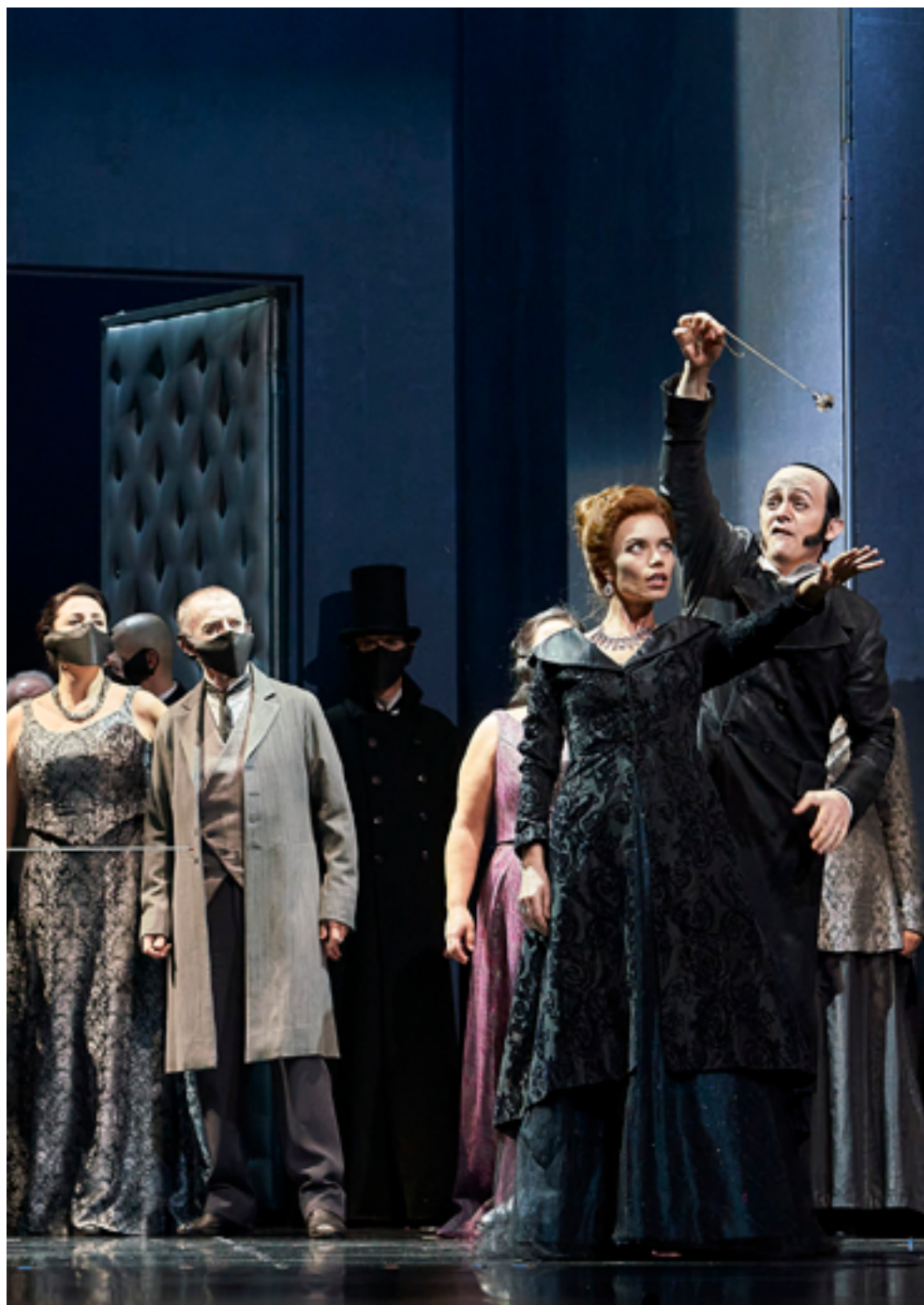
Assaig de Les contes d'Hoffmann al Liceu la temporada 2020/21