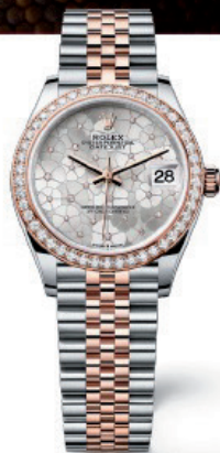
OYSTER PERPETUAL DATEJUST 31