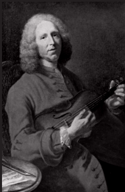
Jean Philippe Rameau

Estrena al Liceu. Amb Platée , el Liceu –que havia programat per a la temporada 2019-20 Alcione de Marin Marais- deixa escoltar per primera vegada entre les seves parets una òpera barroca francesa, de la mà d’un dels millors directors musicals especialitzats en aquest període: William Christie, amb el conjunt vocal i instrumental Les Arts Florissants.