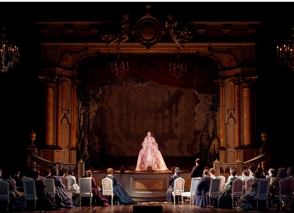
Adriana Lecouvreur - al Gran Teatre del Liceu