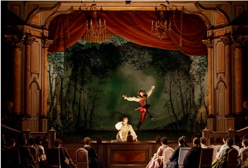
Adriana Lecouvreur al Gran Teatre del Liceu