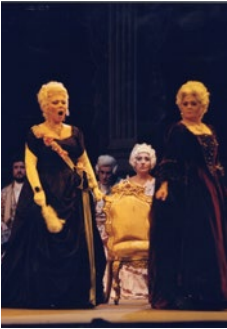
Mirrella Freni, Fiorenza Cossotto