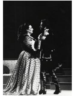
Montserrat Caballé, Josep Carreras

El verisme era un corrent que el Liceu hagué d'acceptar, però amb rebuig. Hi havia el record de Fedora de Giordano amb una bicicleta a escena i, molt pitjor, el final de Tosca de Puccini amb un afusellament davant del públic. No devia ser tampoc gaire favorable el record que va deixar al Liceu l' Adriana Lecouvreur el 1903. La prova és que durant gairebé 40 anys ningú no la va trobar a faltar, i quan es va exhumar, temporada 1941-1942, va ser pel capritx de la diva del moment. Després de l'esclat i la desaparició de les grans sopranos lleugeres Maria Barrientos i Graziella Pareto, barcelonines totes dues, Barcelona, i concretament el Liceu, no havia tingut cap altra diva com la Mercè Capsir. Hi havia debutat el 1914 amb la Gil-