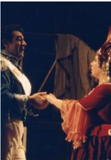
Plácido Domingo, Mirrella Freni