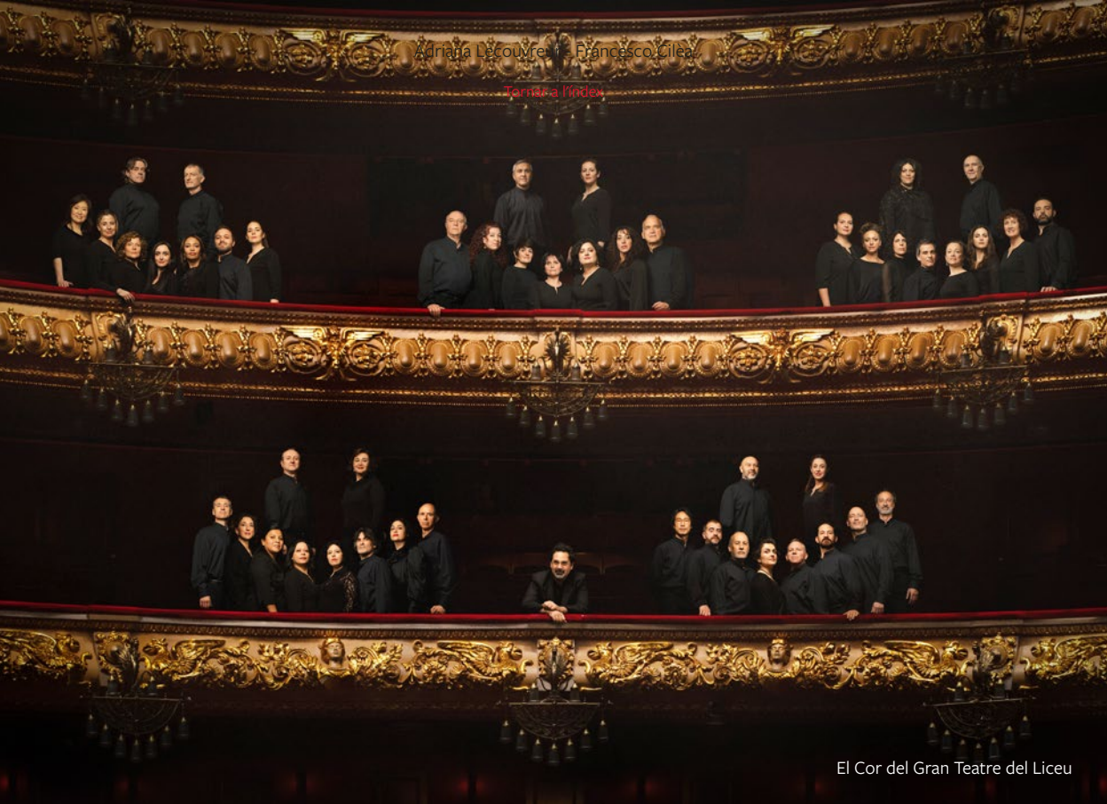
El Cor del Gran Teatre del Liceu