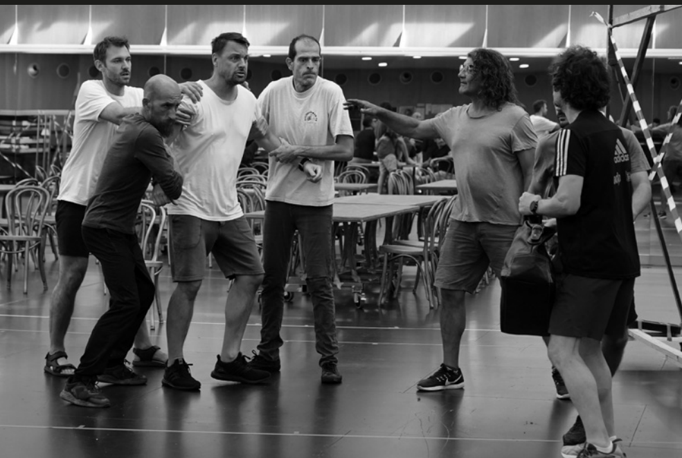
Assaig de Lady Macbeth de Mtsensk al Gran Teatre del Liceu

un Don Juan de taller, obrer de gran bellesa però sense escrúpols. Enverina el seu sogre libidinós per després, ajudada per Serguei, assassinar el marit. En el transcurs de l'aventura dels dos amants, els policies entren a la festa i arresten els culpables, que són enviats a la presó. Katerina no té la sort de cara i, en l'acumulació d'infortunis, encara s'hi afegirà una darrera humiliació: Serguei entrega les seves mitges de llana a una nova amant (Sonietka), la seva darrera conquesta. Desesperada i traïda, Katerina arrossega Sonietka, la seva rival, a un llac glaçat, on moren juntes mentre la resta de convictes desfilen sense aturar-se.