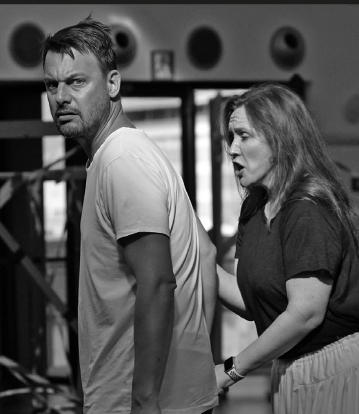
Assaig de Lady Macbeth de Mtsensk al Gran Teatre del Liceu

La violència que exerceix Katerina és el resultat de la impotència que sent davant d'un entorn hostil. El sentiment de buit total l'ha convertit en una bomba de rellotgeria.