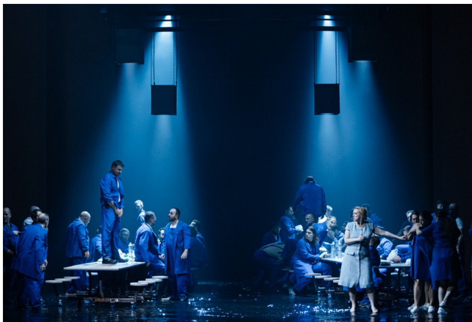
Lady Macbeth de Mtsensk al Gran Teatre del Liceu, Sergi Panizo