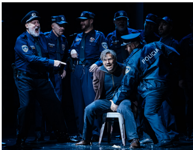
Lady Macbeth de Mtsensk al Gran Teatre del Liceu, Sergi Panizo