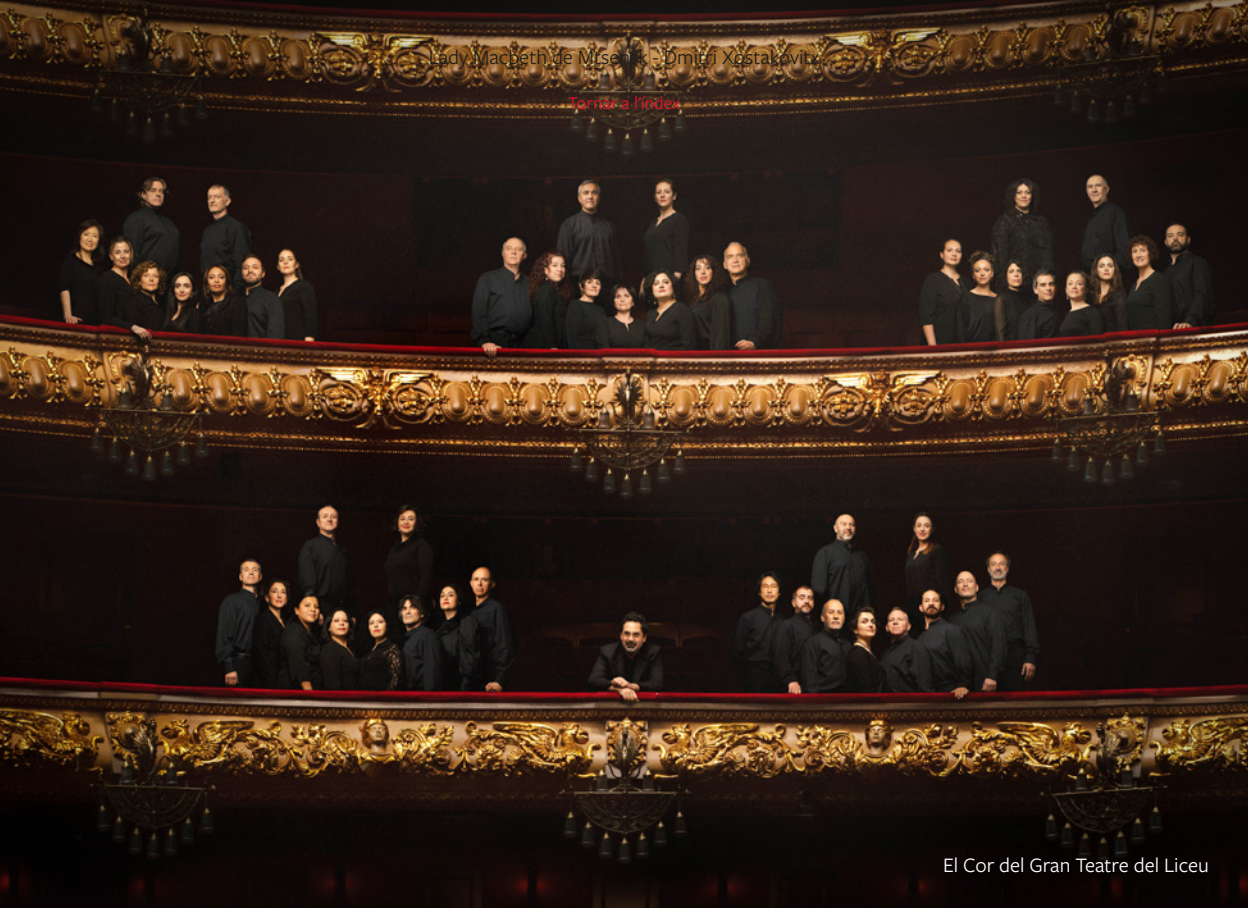
El Cor del Gran Teatre del Liceu