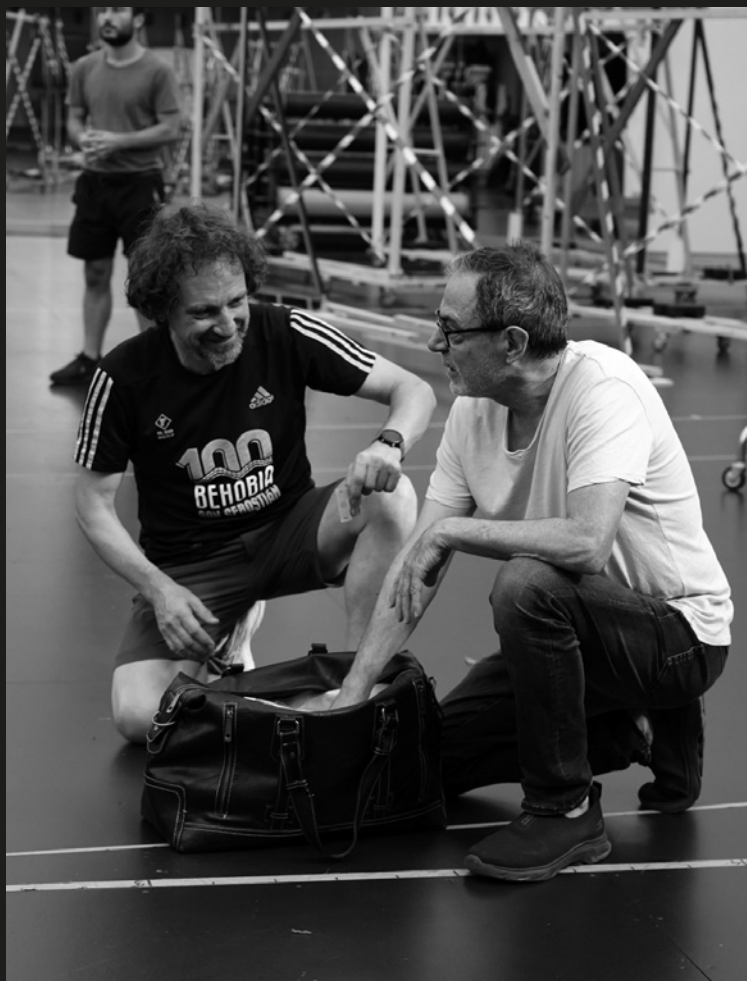
Assaig de Lady Macbeth de Mtsensk al Gran Teatre del Liceu