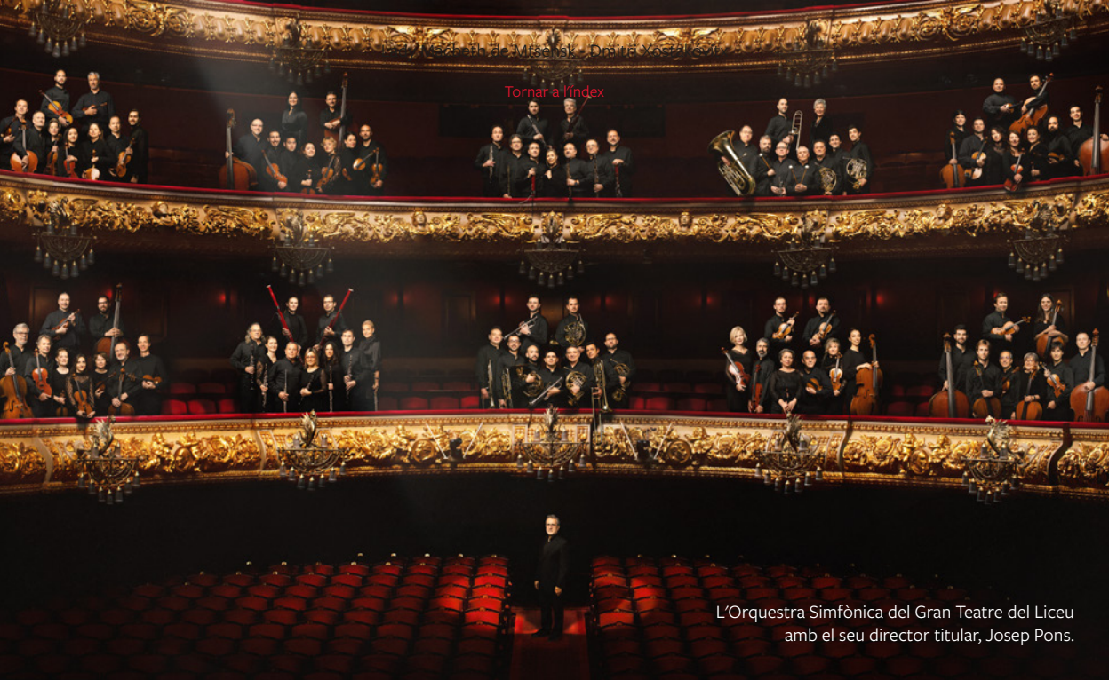
L'Orquestra Simfònica del Gran Teatre del Liceu amb el seu director titular, Josep Pons.